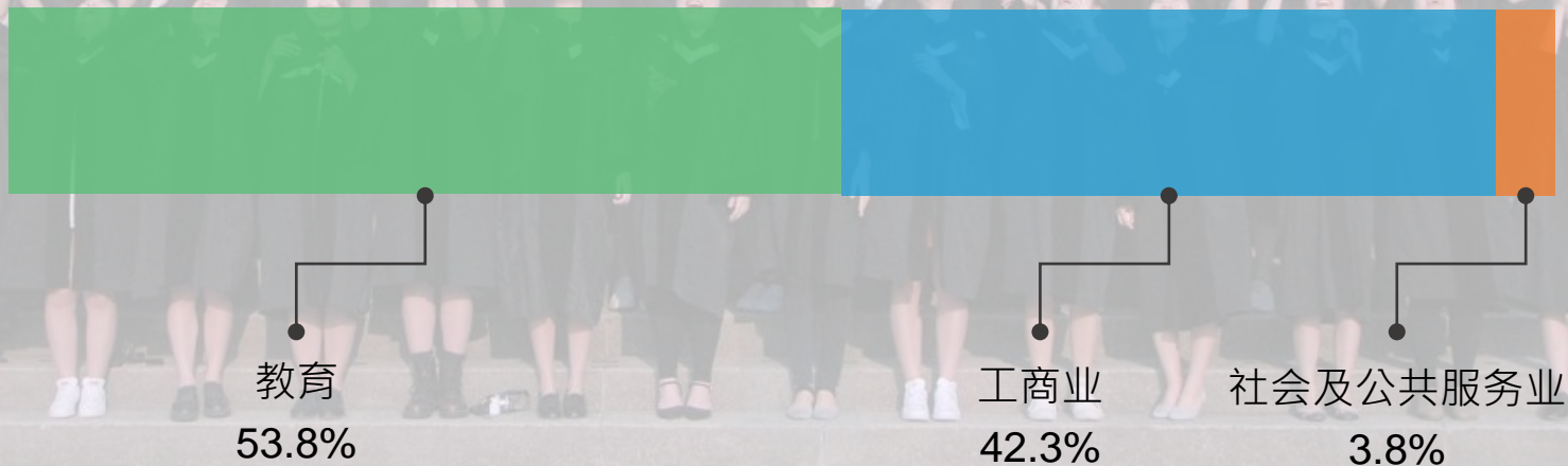
2019年度毕业生从事职业类别统计